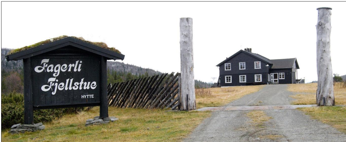
Fagerli Fjellstue, i Nord-Fron er ei av dei mange setrene i rapportområdet som har vore turiststader i over 100 år.

Området er prega av primærnæringa med til dels intensiv bruk av utmarka gjennom mange hundre år. Dei har vore dyktige til å nytte utmarksressursane, det syner dei mange jernvinningsanlegga, kolgroper, fangstanlegg og trekkvegar for elg. Dette har vore med og prega driftsformene og landskapet.