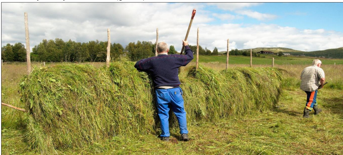
Hesjing på Fagerli, Nord-Fron, her blir kulturlandskapet heldt i hevd.