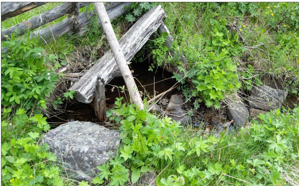
Mjølkekjøling og mjølkerampe på Øvre Frøysesetra i Gausdal, og restar av ei mjølkekjøle ved Øygaardsetra. Her må ein veta kva ei kjøle er for å forstå dei restane ein finn i landskapet.