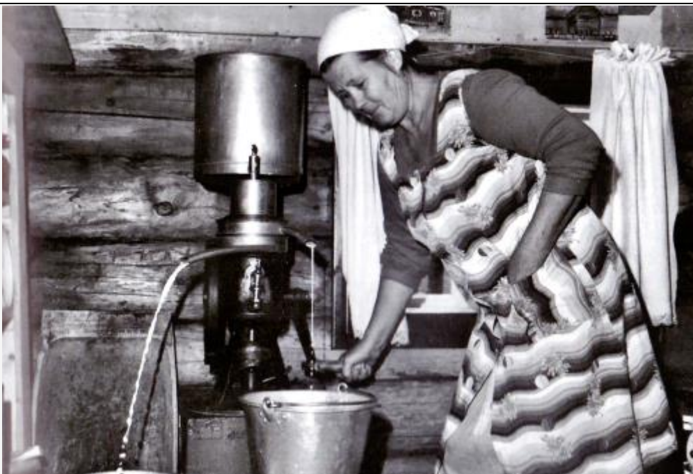
Kvar laurdagskveld «tora» eg. Det var godt å ha ein fløtskveitt på lager. Ungane likte godt å koke seg karamell.