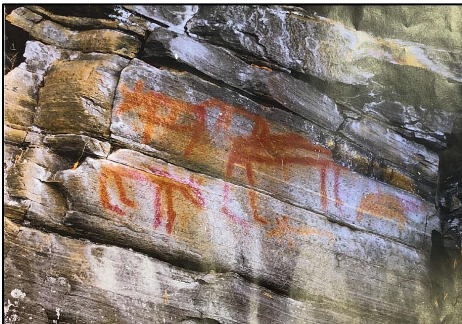
Foto Oppland fylkeskommune/Sør-Fron kommune i si heimeside, krita med raudfarge for fotografering..

Sommaren 2018 vart det oppdaga helleristningar/måleri i Espedalsvatnet som kan vera 4-6000 år gamle (yngre steinalder). Dei syner fem elgar, ein bjørn og noko som kan vera eit menneske. Dei er i ein bratt fjellside rett ved vassflata. Desse er automatisk freda kulturminne.