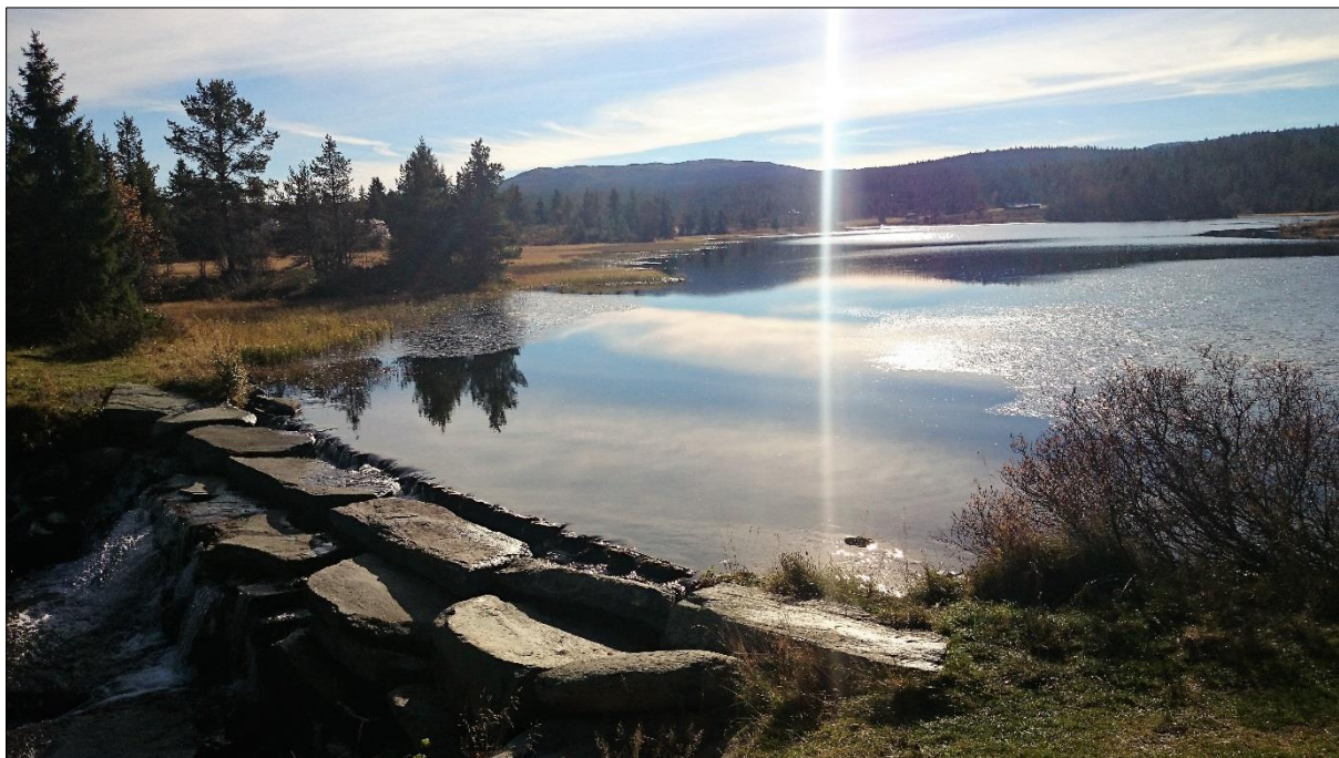
Vollsdammen i Nord-Fron.