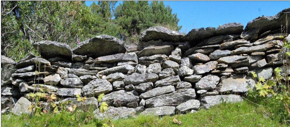
Vakker og solid steingard ved Fagerli, Nord-Fron, særmerkt ved dei store skifersteinane som stikk ut på både sider av muren. Dette er ei anna type berekraft, som ligg som verdjar i landskapet.

3.2.1 Riksantikvaren om verdiskaping: «Verdiskapingsprogrammet på kulturminneområdet (2006-2010) har vist hvordan kulturminner i større grad enn i dag kan bli brukt lokalt og bidra til både miljømessig, kulturell, sosial og økonomisk verdiskaping.» ..«... Målsettingen for verdiskapingsarbeidet er å bruke kulturarv til det beste for befolkning, næringsliv, lokalsamfunn og regioner. Økt kunnskap om verdiskaping gir større muligheter for at kulturminnene blir ivaretatt.» Her ser vi sammenhengen næring/kulturminne = utviklingspotensiale. Dette har relevans for den meir kulturminnebaserte delen av verdiskapinga i rapportområdet.