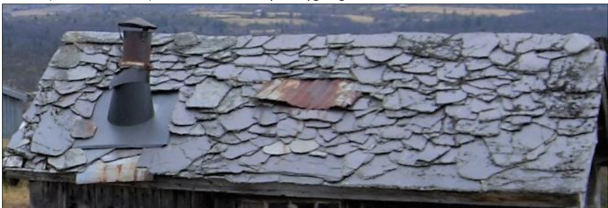
Eit av dei mange særprega villskifertaka i området, her ser ein korleis dei har prøvd å reparere med gamle bølgeblikklater. Sjå særleg høgre kant av taket, kor fint dei har lagt steinen..

Taktekking I dette området var det tidlegare også med vanleg torvtak, skifer vart vanleg utover på 1700-talet, fyrst med villskifer, seinare meir forma skifer. Skiferen vart lagt rett på det gamle torvtaket. Det var vanleg både med og utan bordtak under steinen for å få god lufting. På uthusa var det ikkje så ofte med bordtak under. Vi har funne eit par låvar med teglstein (dobbeltkrumma), men dette er litt nyare bygningar.