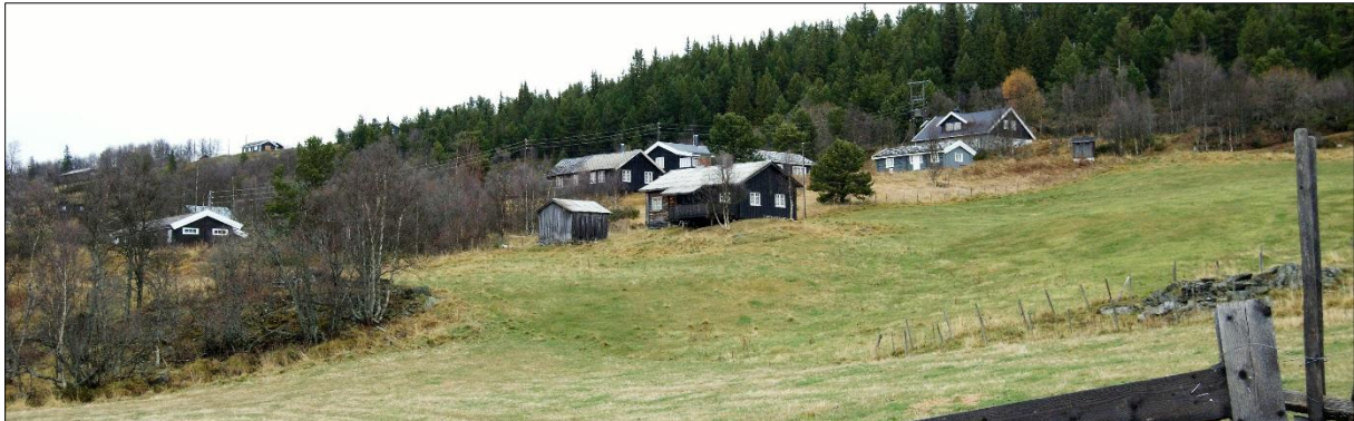
Fagerlistra, Nord-Fron, her ser vi moderne fritidshus som bryt med det tradisjonelle preget på setra.

Nye tiltak bør i stor grad vera underordna eksisterande anlegg i dei opne seterstulane. Større hyttefelt kan bli lagt i skogområde rundt seterstulane. Kveer/Lykkjer bør vera utan nyare bygningar.