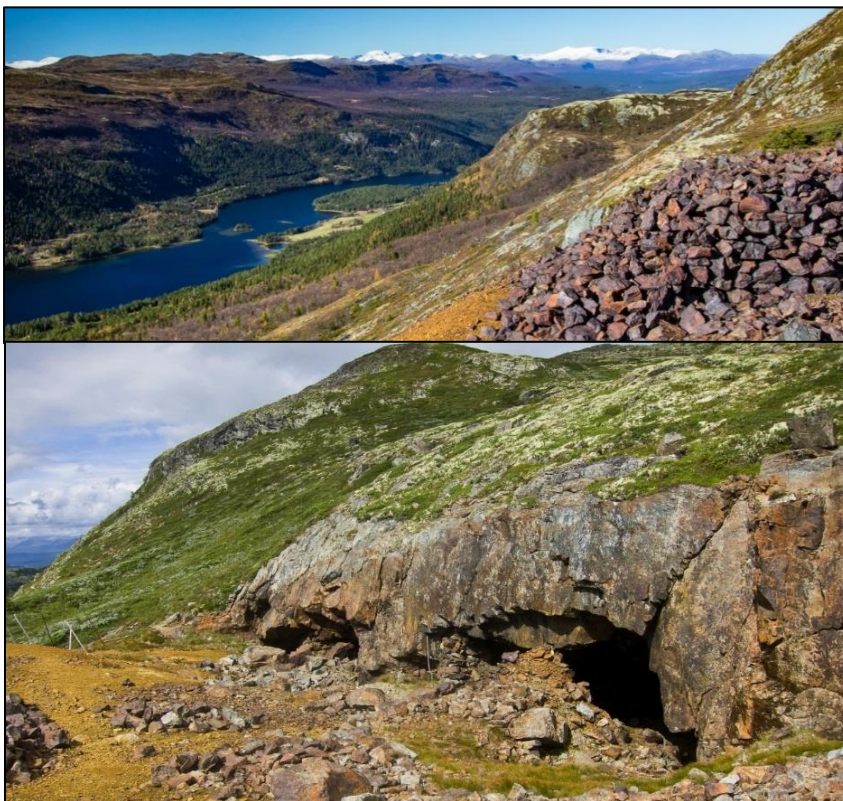
Foto frå Storgruva (Evans Mine) øvst mot nord, ned mot Espedalsvatnet.

Området er prega av primærnæringa med til dels intensiv bruk av utmarka gjennom mange hundre år. Dei har vore dyktige til å nytte utmarksressursane, det syner dei mange jernvinningsanlegga, kolgroper, fangstanlegg og trekkvegar for elg. Dette har vore med og prega driftsformene og landskapet.