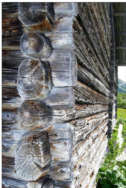
Biletet viser fine lafteknutar frå ein låve på Holen seter, Gausdal.

Rapportområdet omfattar eit landskap med omfattande vegstrukturar på kryss og tvers. Delar av områda er dominert av hytte og friluftsliv, kopla med eit stadig meir aktivt reiseliv. Dette kan vera grunnlag for konflikter og gjev samstundes grunnlag for vekst i godt samspel med ulike interessegrupper.