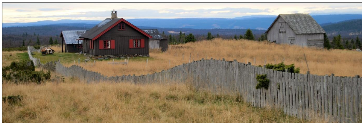
Busetra i Sør-Fron har gode seterhus med inngjerding og plen rundt selet. Utan beiting vil kulturlandskapet raskt endre seg.

Etter 1980 er eit fåtall av setrene i bruk som seter med mjølkeproduksjon. Det store geitehaldet fekk ein knekk med atomnedfall etter Tsjernobylulykka i 1986. Seterbeitet vart hardt råka og mange avslutta i tida etterpå. Det vart omfattande behov for nedbeiting av sau og geit på heimebeite om hausten. Dette svekka økonomien på geitemjølkbuka, og førte til endra beite av innmark og utmark i fjellet.