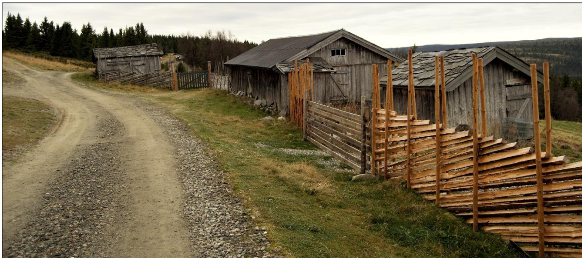
Åsen seter, Sør-Fron, med ny skigard.