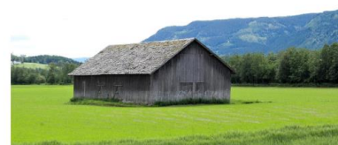
Låve med viltkifertak i Fåvang